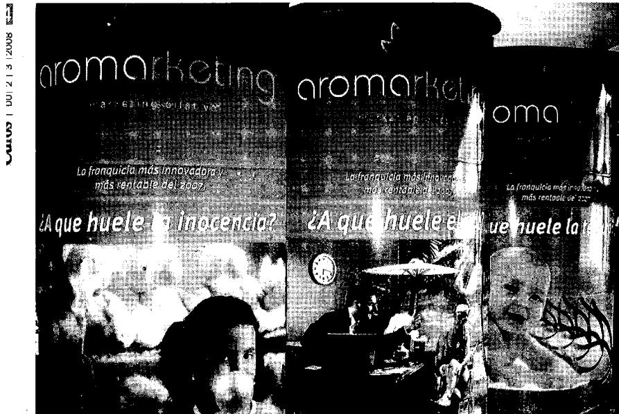
Carteles anunciadores de la franquicia de marketing olfativo, dirigido al mundo infantil. JLP